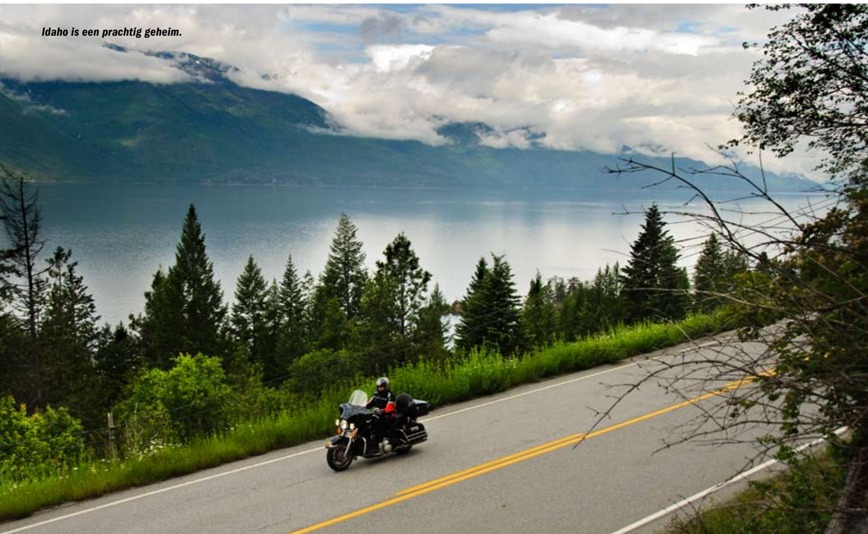
Idaho is een prachtig geheim.

Re e , e e , eve Zo lastig als de douane altijd doet bij binnenkomst in de Verenigde Staten, zo gemakkelijk zijn ze als je het land weer verlaat. Na het verplichte 'thank you for your visit' rijden we de provincie British Columbia in, mijn eerste meters in Canada. In twee dagen tijd zullen we de International Selkirk Loop rijden in de >