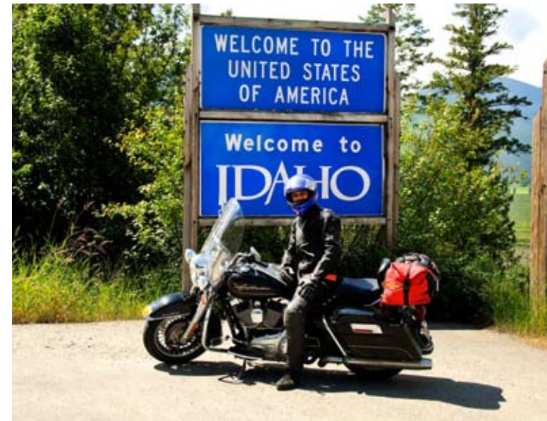
Aan de Amerikaans-Canadese grens.

negentiende eeuw. Ze werden uiteindelijk na een maand sterk vermagerd, maar levend teruggevonden. De winkel van Rusty is van bodem tot plafond gevuld met allerlei prullaria, van hertengeweien tot oude sneeuwschoenen of een heuse jas "die John Wayne ook droeg in een van zijn films". Rusty is een mooi figuur en we blijven dan ook lang bij hem kletsen. Het Glacier Nationaal Park ligt op de