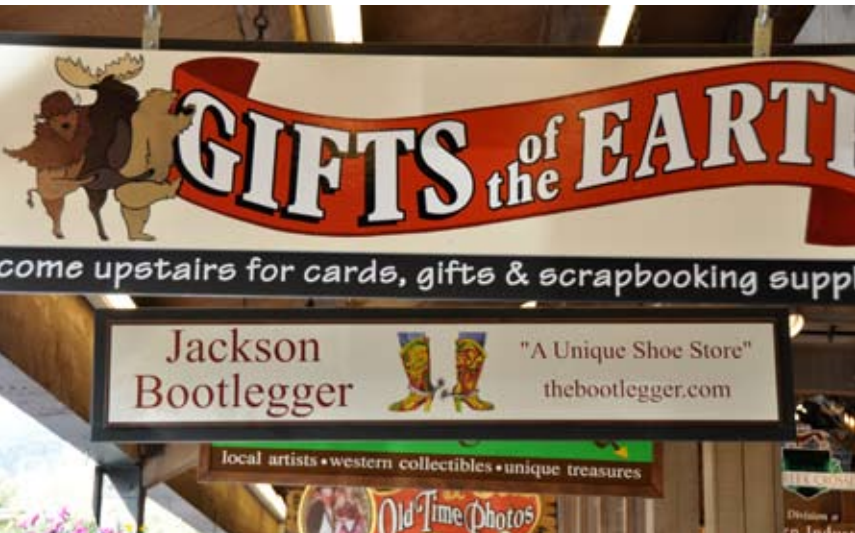
Soms lijkt de tijd stil te hebben gestaan.

Het is in Logan, Utah even zoeken naar de route die ons naar de Logan Canyon voert, maar eenmaal op pad worden we beloofd met een prachtige slingerweg door bossen en canyons om uiteindelijk boven aan Bear Lake te komen. Het water is spiegelglad en weerkaatst de Rocky Mountains als ware het een foto. Een Amerikaanse biker (uiteraard zonder helm en in gewone spijkerbroek) komt bij ons zitten genieten van het uitzicht. Hij woont 1500 mijl verderop, maar is met trailer, Harley en caravan hiernaartoe gekomen om te werken. Zes