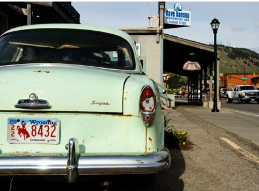
Amerika is vaak zoals je het in de film ziet.

komt ons tegemoet en een groepje werklui met baseball petjes, tattoos en overalls zijn ook neergestreken. Ze vinden het werkelijk geweldig dat we helemaal uit Nederland zijn gekomen om hier op de motor door hun land te rijden. Dit zijn reacties die we de hele tijd onderweg horen als we de erg vriendelijke bevolking spreken van supermarkt en benzinepomp tot hotel. Als ik naar het toilet loop