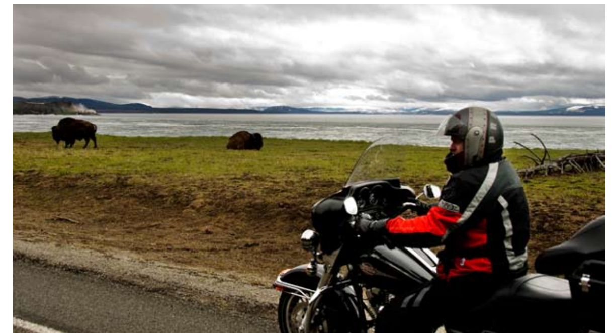
Bizons langs de weg.