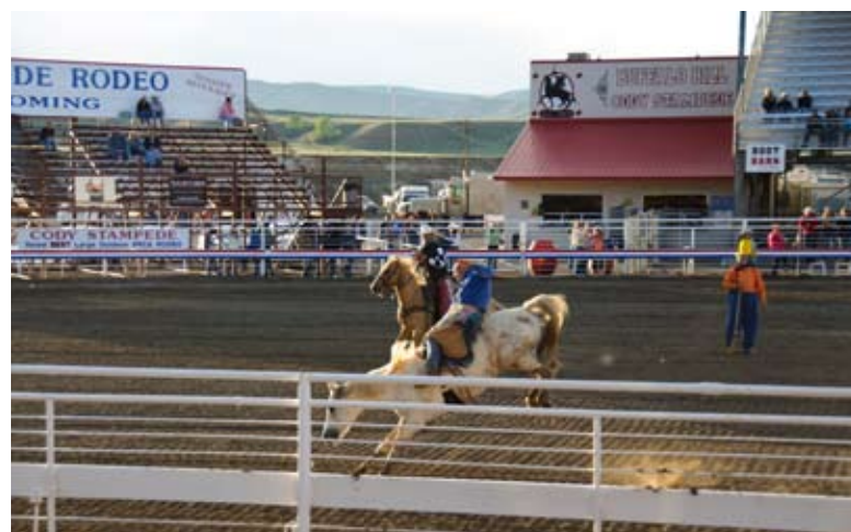
Een rodeo is leuk om een keer te zien. Eén keer...