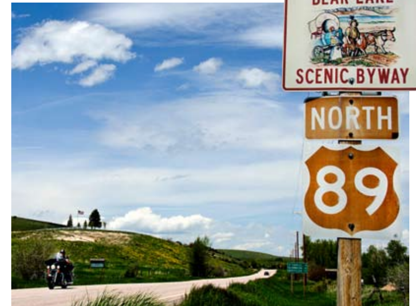
Rust, ook op de wegen.

staan. Leuk idee, ware het niet dat dit rubber spekglad is. Het gebeurt een paar keer dat de 368 kilo's van de Road King vervaarlijk onder me aan het schuiven zijn. In India verwacht je dit, in Amerika totaal niet, omdat je volgens mij nergens